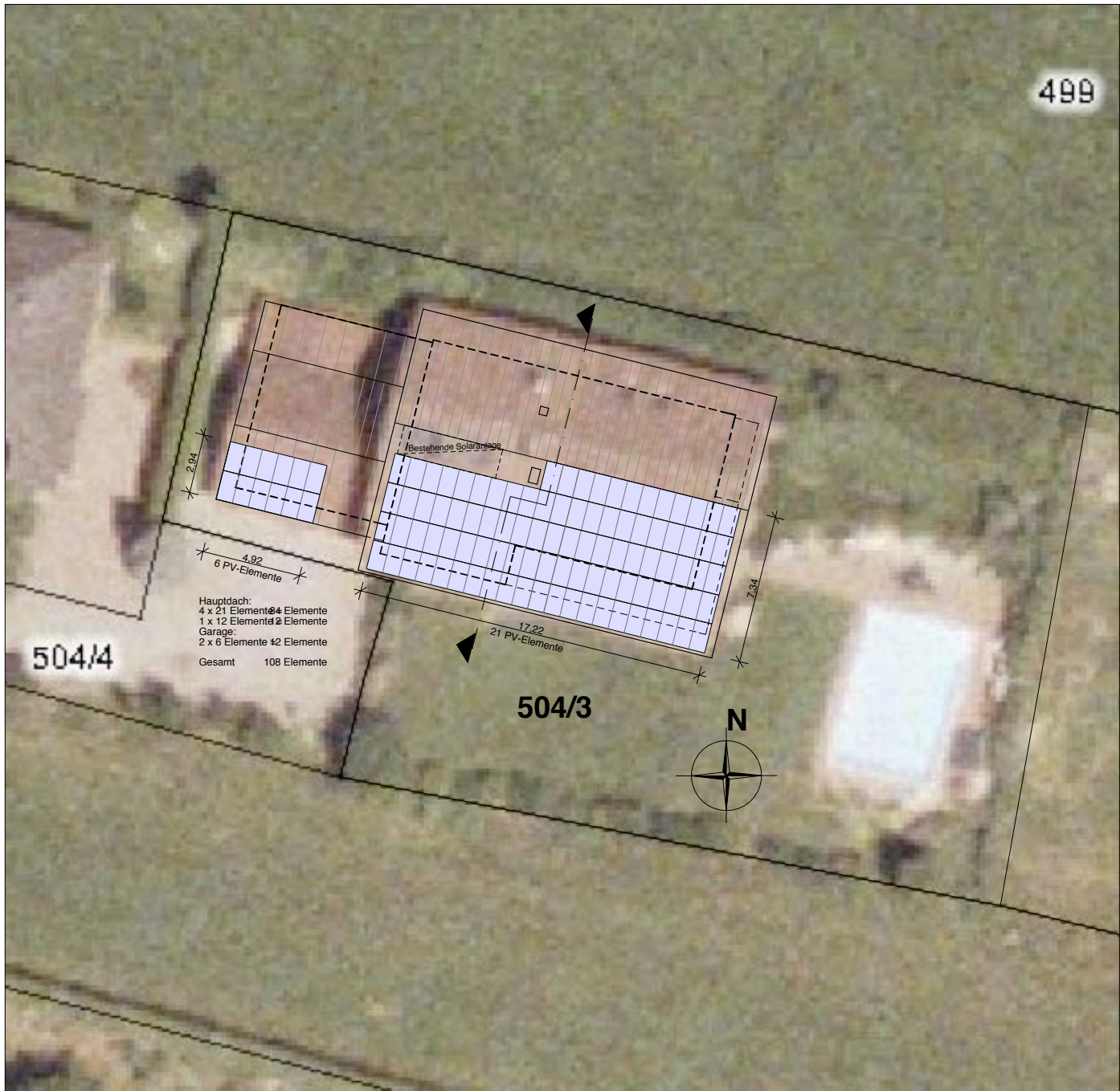
Lageplan M 1:300